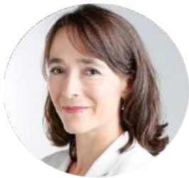
DELPHINE ERNOTTE CUNCI Marraine du JFD Connect PDG France Télévisions

« Le numérique a bouleversé notre manière de consommer la télévision. De nouveaux enjeux sont apparus et constituent le socle de ce que sera France Télévisions dans le futur. Je suis ravie de participer à la Journée de la Femme Digitale pour ma vision du futur des médias. Très heureuse aussi d'être la marraine du JFD Connect, un club acteur de la promotion de l'innovation au féminin »